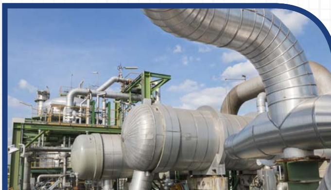
REFRIGERAÇÃO COM AR E TROCA DE CALOR